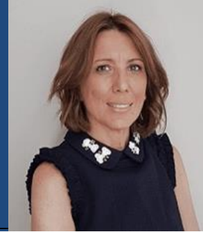
MÓNICA TEJEDOR ALSTOM

Actualmente es Consejera Delegada de ENGIE España, posición desde la que ha liderado el reenfoque de la operativa del Grupo en el contexto de la transformación del sector energético en el mundo.